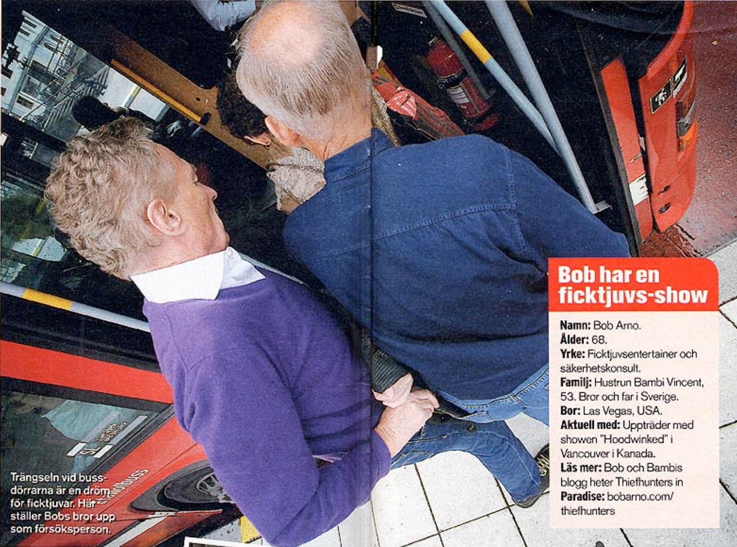
Trängseln vid busstörrarna är en dröm för ficktjuvar. Här ställer Bobs bror upp som försöksperson.

En stund senare traskar en 60-årig affärsman förbi i säckig linnekostym.